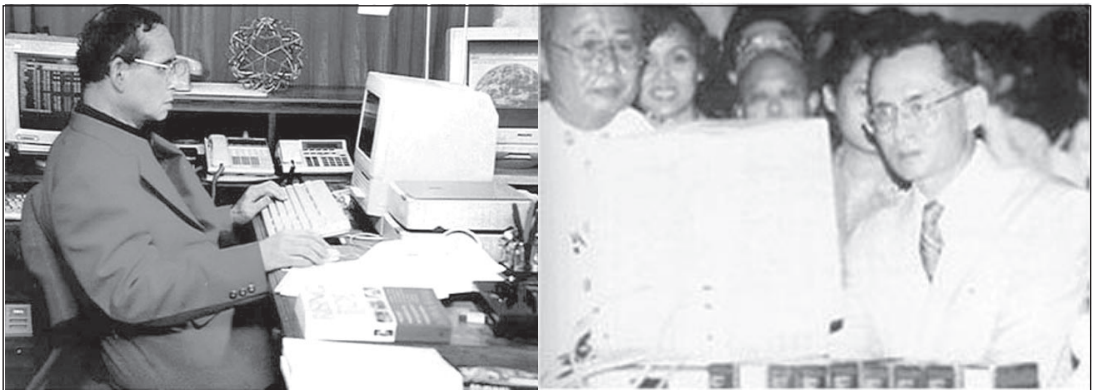
พระบาทสมเด็จพระเจ้าอยู่หัว พระผู้นำและจุดประกายวงการคอมพิวเตอร์ในประเทศไทย

เป็นที่ประจักษ์กันโดยทั่วไปแล้วว่าคอมพิวเตอร์และอินเทอร์เน็ตได้มีบทบาทสำคัญต่อการพัฒนาเศรษฐกิจและสังคมของประเทศไทย มาเป็นระยะเวลากว่า ๔ ทศวรรษ นับเนื่องแต่พระบาทสมเด็จพระเจ้าอยู่หัวภูมิพลอดุลยเดชมหาราช ทรงเสด็จประพาสโรงงานคอมพิวเตอร์ใหญ่ของไอบีเอ็มที่ซิลิคอนวัลเลย์ มลรัฐแคลิฟอร์เนีย สหรัฐอเมริกา เมื่อเดือนกรกฎาคม ๒๕๐๓ เพื่อจุดประกายให้วงการคอมพิวเตอร์ของประเทศไทยคิดถึงการใช้คอมพิวเตอร์เพื่อพัฒนาเศรษฐกิจและสังคมของชาติให้ทัดเทียมประเทศที่เจริญแล้ว ๑