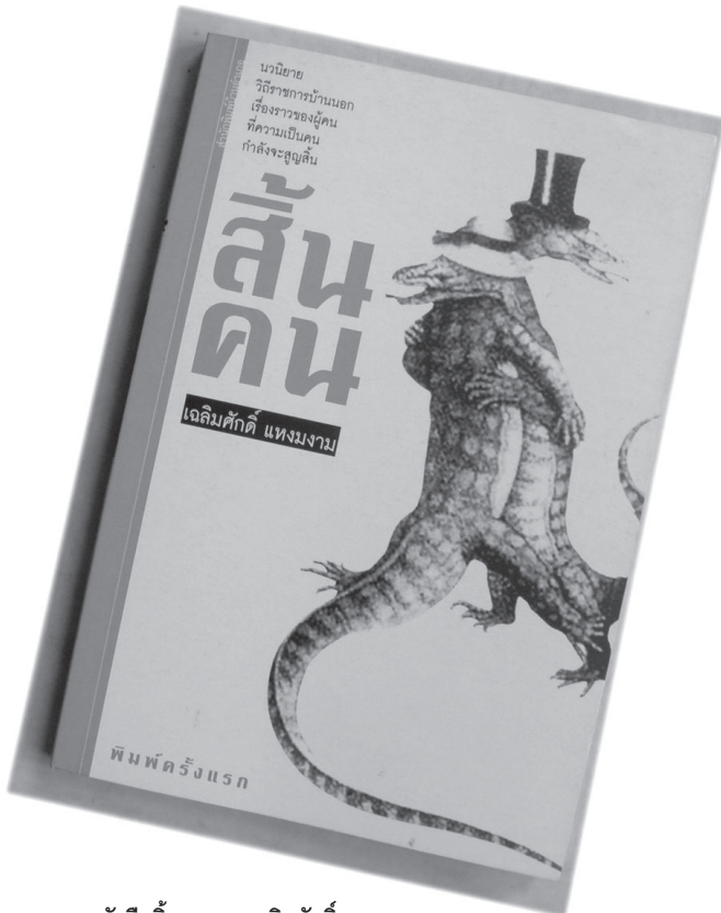
●หนังสือสิ้นคนของเฉลิมศักดิ์ แห่งงวม