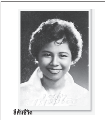
สีสันชีวิต