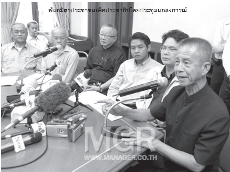
พันธมิตรประชาชนเพื่อประชาธิปไตยประชุมแถลงการณ์

คณะกรรมการพันธมิตรประชาชนเพื่อ ประชาธิปไตยคณะเดิม จึงนัดประชุมด่วน แล้ว แถลงให้ประชาชนทราบ เราเจียบบมาปีครึ่ง นึก ว่าสบาย ไม่ต้องเหนื่อย ทำอะไรอีก ก็จำเป็นต้อง รวมตัวกันอีกจนได้ เตือนให้ประชาชนพร้อมที่จะ เสียสละความสุขส่วนตัวช่วยบ้านเมืองอีกครั้ง ท่านสมาชิก “เราคิดอะไร” บางท่านอาจไม่ทราบ ผมเลยขอเอาแถลงการณ์มาเผยแพร่