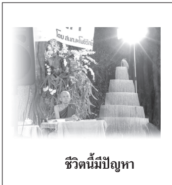
ชีวิตนี้มีปัญหา