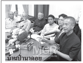
บ้านปานดอย

เอโกปี หุควา พุธา โทคิ พุธาปี หุควา เอโก โทคิ จากหนึ่งจึงเป็นเรา รวมเราเขาเข้าเป็นหนึ่ง