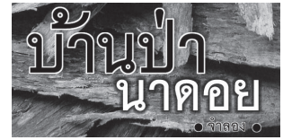
● ทำวัตรเช้า ๐๓.๓๐ น. พุทธาภิเษกสุดยอด ปาฏิหาริย์ครั้งที่ ๓๒

วันต่อมาผมหาโอกาสไปพบสมภารองค์นั้น เป็นการส่วนตัว ก้มลงกราบแล้วถามท่านตรงๆ ว่า ท่านจะจัดงานฝังลูกนิมิตไปทำไม เพราะตรง ข้ามกับคำสอนของพระพุทธเจ้า ท่านก็บอก ตรงๆ ว่าเป็นการหาเงินเข้าวัด เหมือนวัดอื่นๆ ไป เกือบจะตกกับท่านต่อถึงเรื่องเงินว่าเป็นสิ่ง ต้องห้ามสำหรับพระ รวมทั้งเกือบจะยกบท แยกธรรมแยกวินัยมาอ้างก็จะเป็นการสอนพระ ทำให้สมภารท่านเกลียดชังหน้าเปล่า เลยสรุปย่อๆ ว่า ผมเป็นประธานเปิดงานปิดทองฝังลูกนิมิต