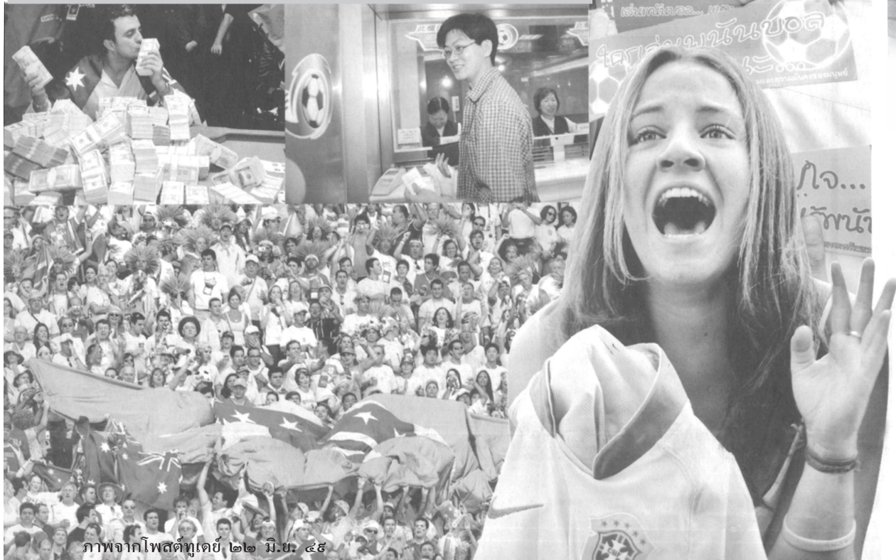
พนันบอลร้อนๆ จ้า เร่เข้ามา...หายหน้าหนีกลับ