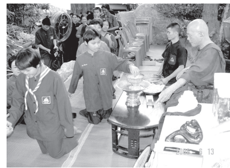
๖. เษการ...ที่หมู่บ้านชุมชนราชธานี โศก เวลาถึงงานอบรมนักเรียน ทางคณะครูก็จะให้สร.สัมมาสิกขาฯ เป็นผู้รับผิดชอบงานอบรมทั้งหมด คือ เป็นการเรียนแบบบูรณาการ นักเรียนก็ได้ลงมือปฏิบัติจริง ไม่ว่าจะเป็นที่เลี้ยงประจำกลุ่ม,เป็นพิธีกร,เป็นผู้นำออกกำลังกาย,นำเสนอและสาธิตมารยาทไทย,นำเสนอทางการ,สาธิตงานอาชีพ (เช่น สาธิตทำน้ำเต้าหู้,ปาท่องโก๋,บัวลอย,อาหารต่างๆ,น้ำยาซักผ้า,น้ำยาล้างจาน เป็นต้น) พาน้องๆปฏิบัติงานตามฐานงานต่างๆ รวมถึงไปเวลาอนอกก็ไปพักกับนักเรียนที่มาอบรมด้วย ฯลฯ