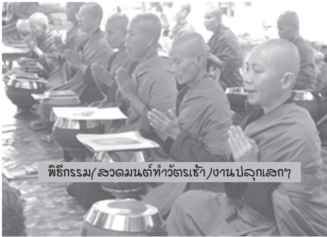
พิธีกรรม/ ลวดมนต์ทำวัตรเช้า/ งานปลุกเสกฯ