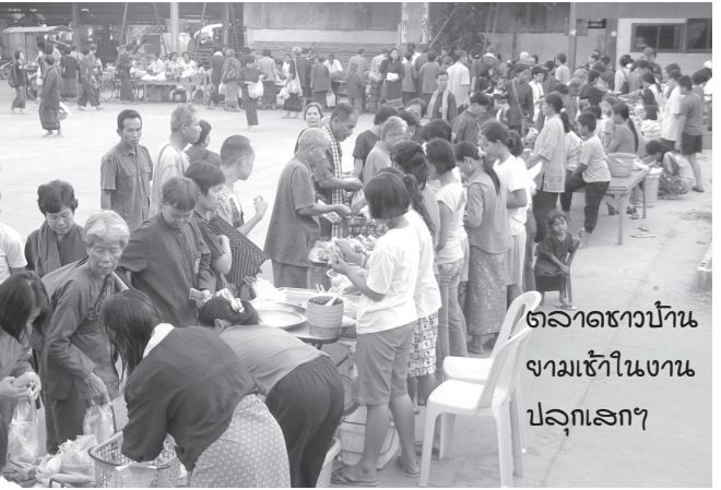
ตลาดชาวบ้าน จามเข้าในงาน ปลุกเสกฯ