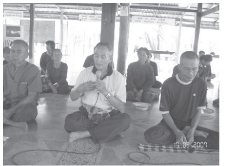
เบิกบาน สงบเย็น โส้งโปร่ง ไม่ค้างคาใจ เบาว่างสบาย มหัศจรรย์จริงหนอคอร์สนี้

ในวันปิดคอร์สอย่างเป็นทางการ มีผู้เข้าร่วมจำนวน ๓๔ คน ตรงกับ มงคล ๓๘ ข้อที่ ๓๔ ที่ว่า “การได้พบพระนิพพานเป็นมงคลอันอุดม” เสียงการเปิดใจในช่วงปิดคอร์สสรุปรวมๆจับใจความได้ว่า ทุกคนยินดีในศีล