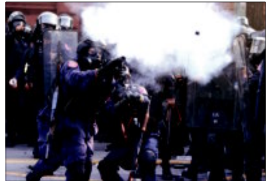
ชี้เป้าแล้วกระหน่ำยิง