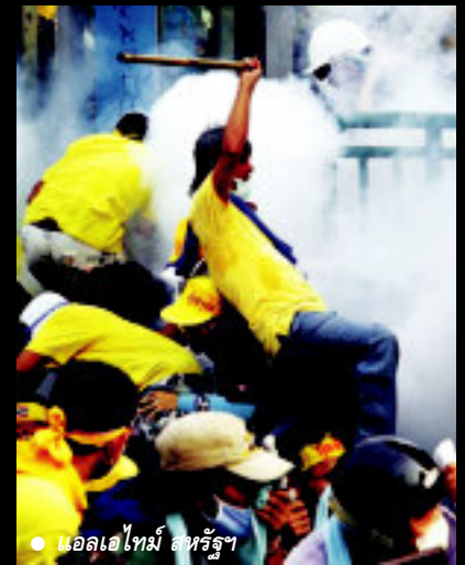
● แอลเอไทม์ สหรัฐฯ