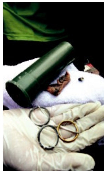
เศษเนื้อและสั้กระดูกเบ็ด หลักฐานในพื้นที่