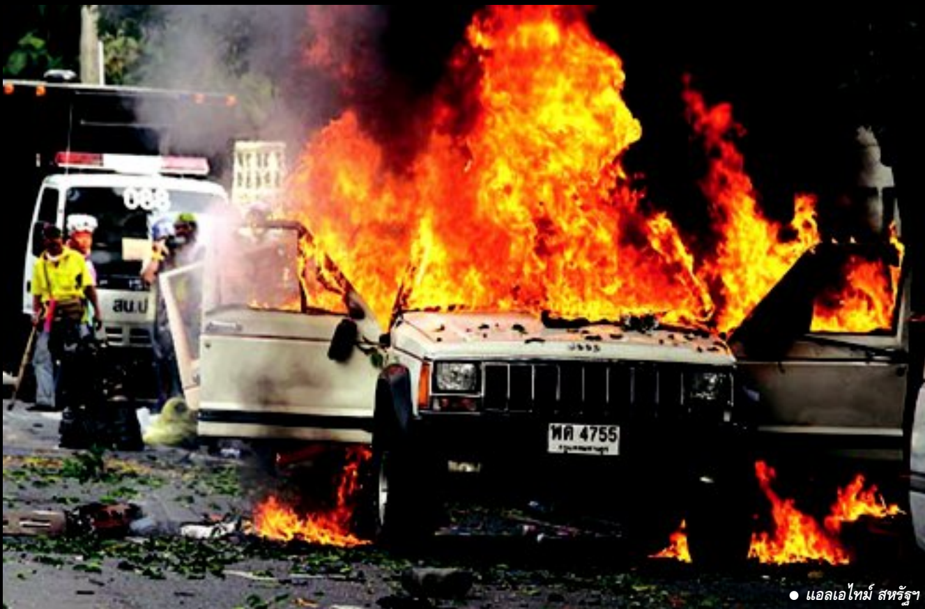
● แอลเอไทม์ สหรัฐฯ