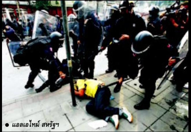
● แอลเอไทม์ สหรัฐฯ

ความรุนแรงป่าเถื่อนของตำรวจไทย สื่อต่างชาติได้บรรยายอย่างชัดเจนว่า เป็นการปราบปรามที่รับไม่ได้ ภาพบางภาพหรือคลิปวิดีโอ ต่อมาได้เป็นภาพเด่นประจำวันของเว็บไซต์หลายแห่ง