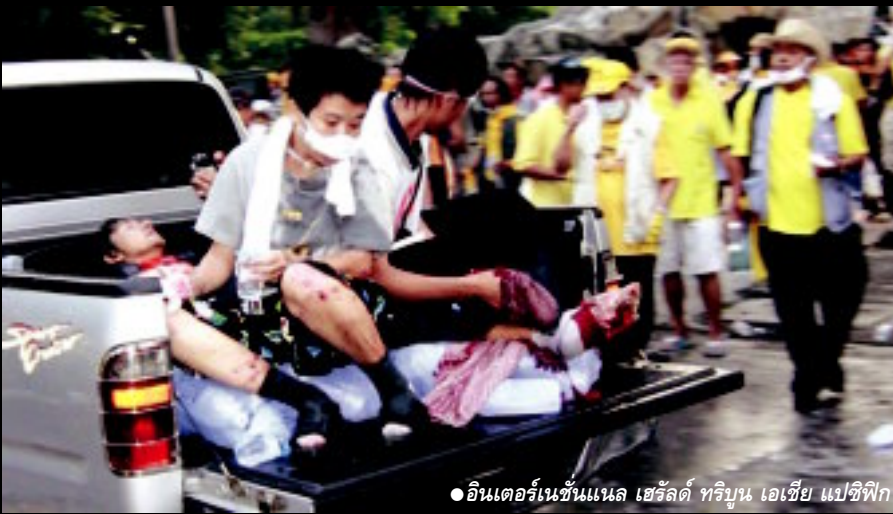
● อินเทอร์เน็ต เนชั่นแนล เฮรัลด์ ทริบูน เอเชีย แปซิฟิก