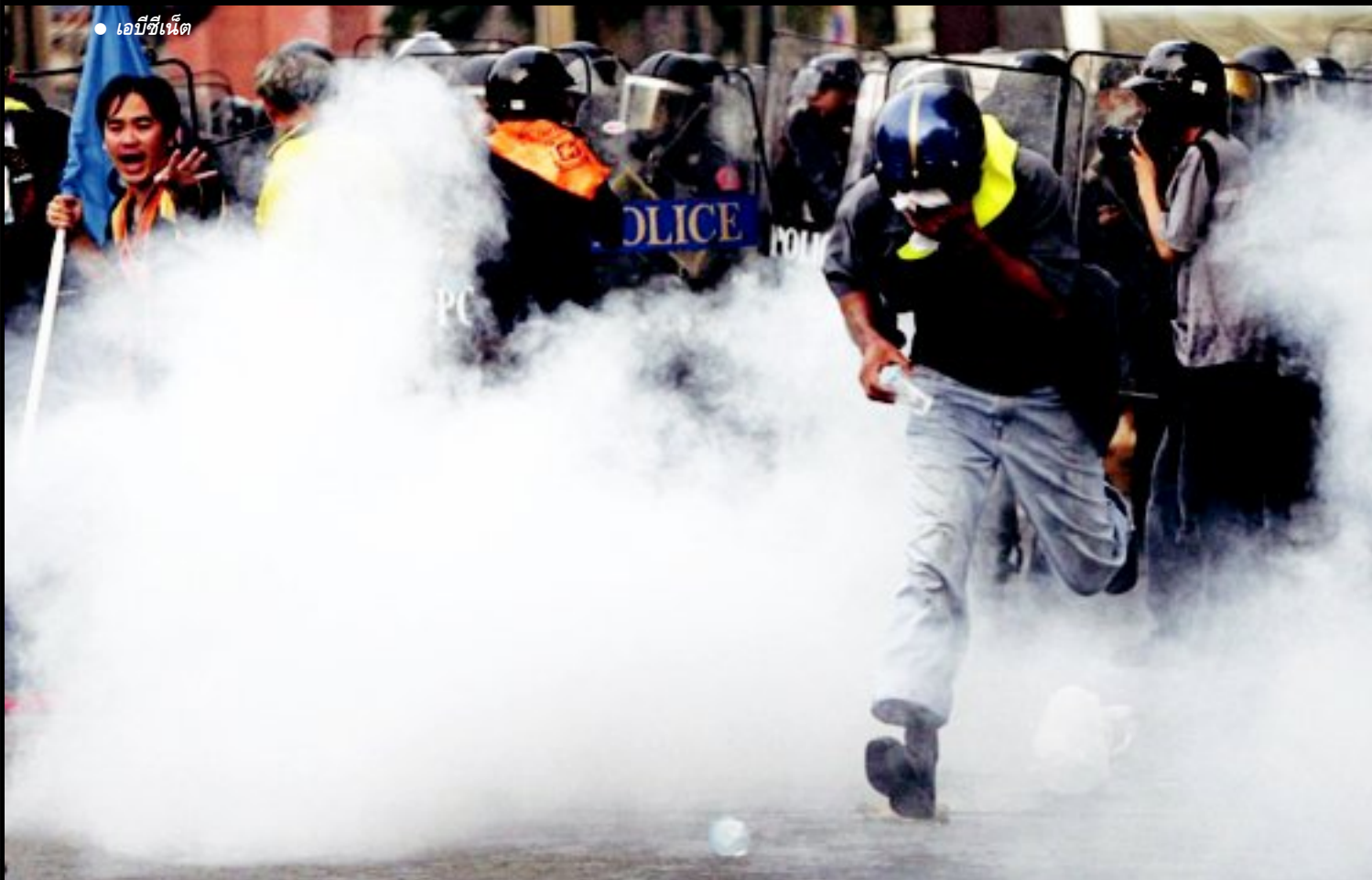
● เอบีซีเน็ต