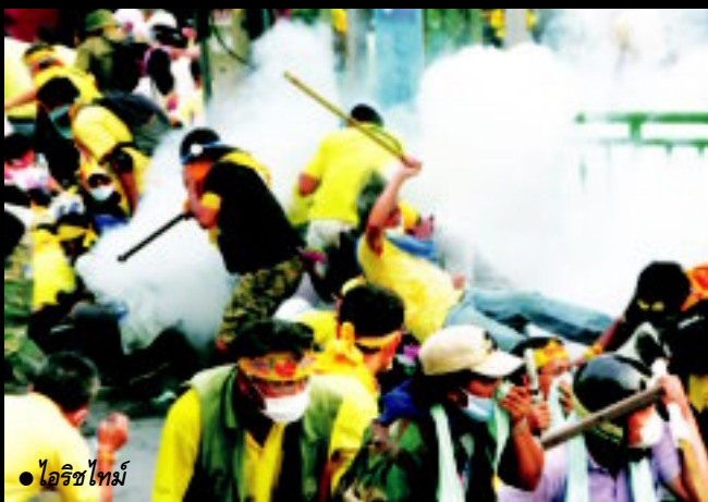
● ไอริชไทยม์