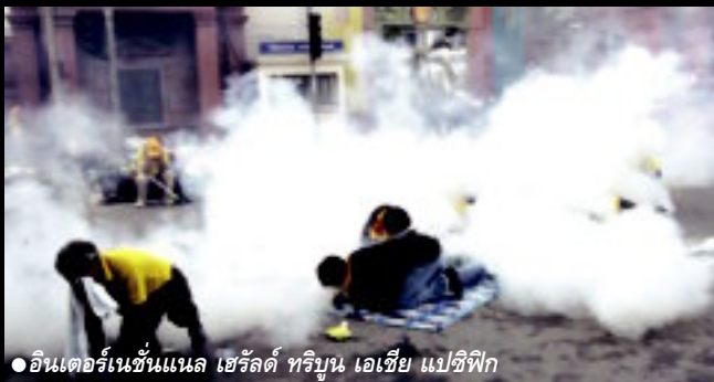
● อินเทอร์เน็ตชนแนล เซร์ลด์ ทริบูน เอเชีย แปซิฟิก

นอกจากสื่อไทยทุกแขนงจะรายงานภาพและข่าวสารเผยแพร่ พฤติกรรมที่เหี้ยมโหดของตำรวจไทยที่ใช้กำลังสลายฝูงชน สื่อออนไลน์และหนังสือพิมพ์ทั่วโลกก็ตีแผ่ภาพปฏิบัติการอัยยศ นี้ไปทั่วโลก