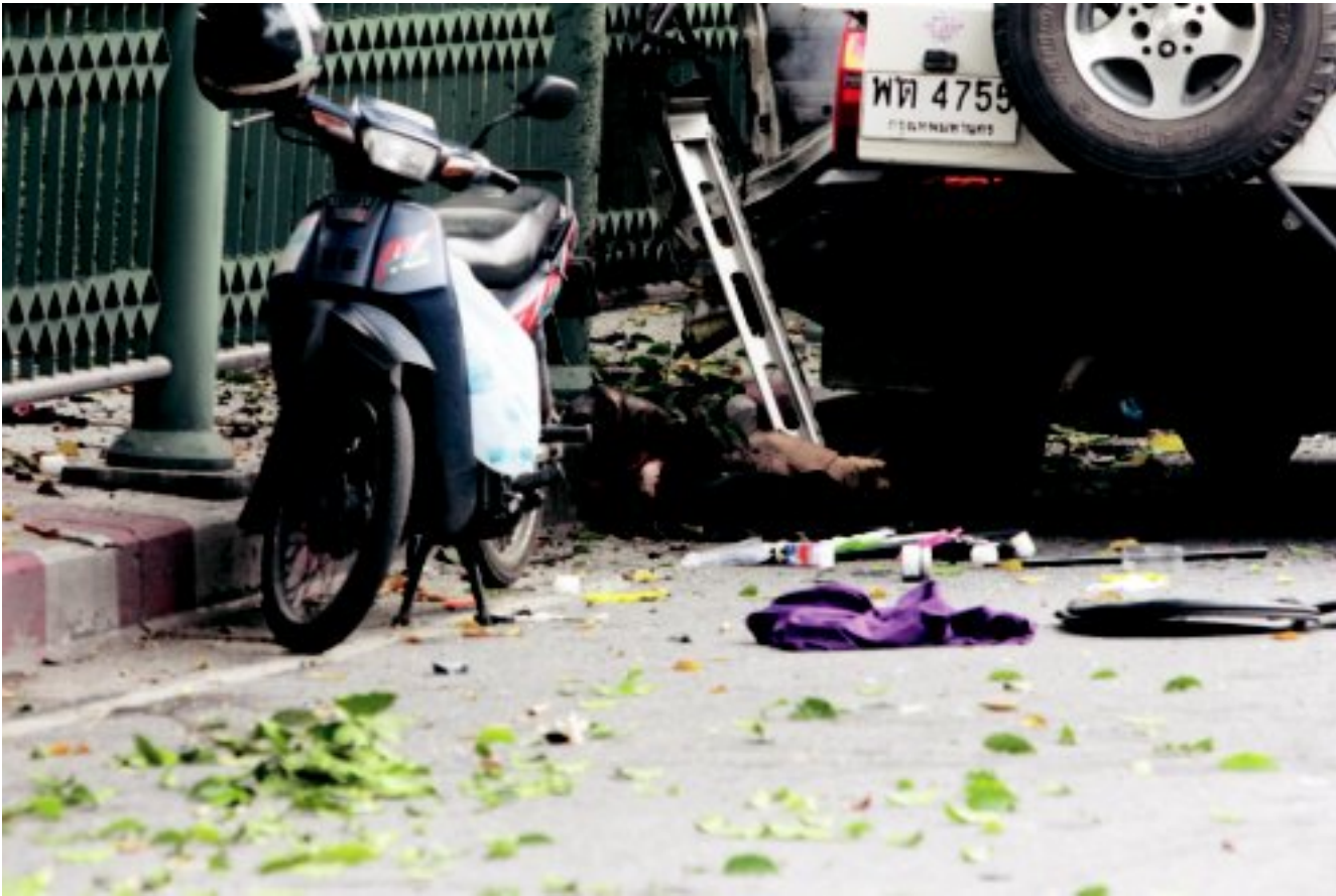
ร่างไร้วิญญาณ ของ พ.ต.ท.เมธี ชาติมนตรี หรือ “สารวัตรจ๊าบ” อยู่ข้างรถจี๊ป ซึ่งตำรวจป้ายสีว่าเป็นรถชนระเบิด ของพันธมิตรฯ