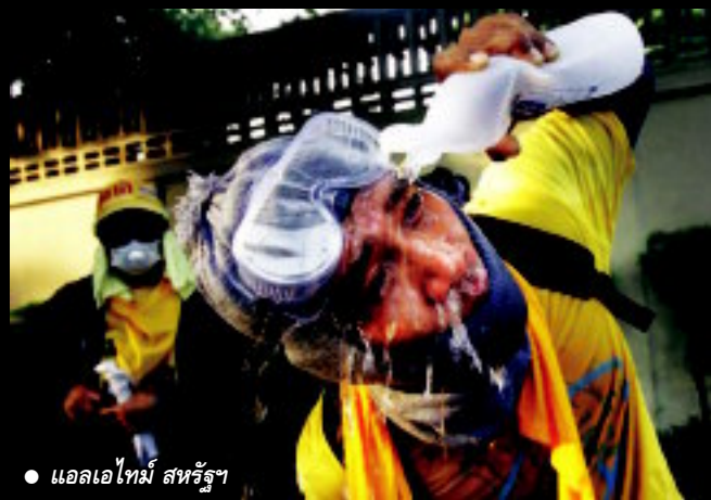
● แอลเอไทยม์ สหรัฐฐา