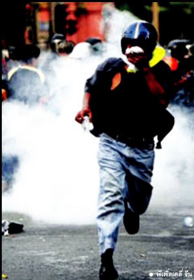
● พีเพิลเดลี จีน

นอกจากสื่อไทยทุกแขนงจะรายงานภาพและข่าวสารเผยแพร่ พฤติกรรมที่เหี้ยมโหดของตำรวจไทยที่ใช้กำลังสลายฝูงชน สื่อออนไลน์และหนังสือพิมพ์ทั่วโลกก็ตีแผ่ภาพปฏิบัติการอัยยศ นี้ไปทั่วโลก