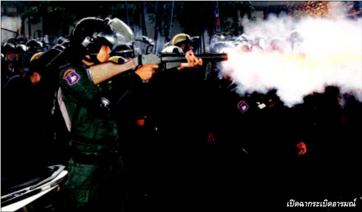
เปิดฉากระเบิดอารมณ์