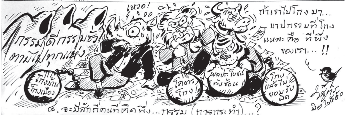
๔. จะมีสักกี่คนที่ติดพึ่ง...กรรม (การกระทำ)...?