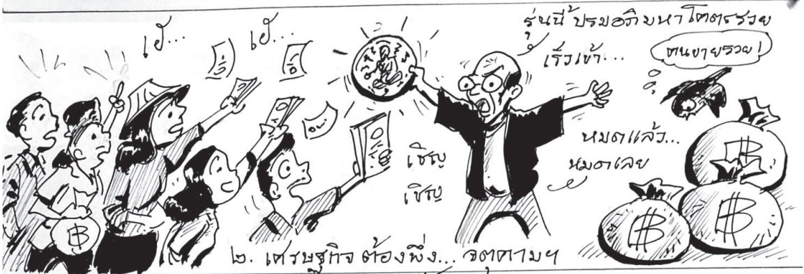
๒. เศรษฐกิจต้องพึ่ง... จตตาม