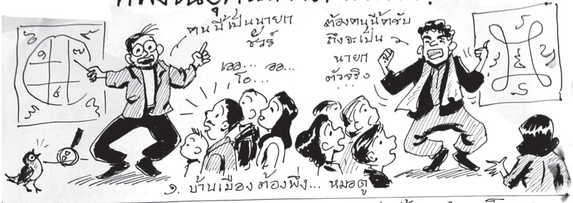
๑. บ้านเมืองต้องพึ่ง... หมอตู