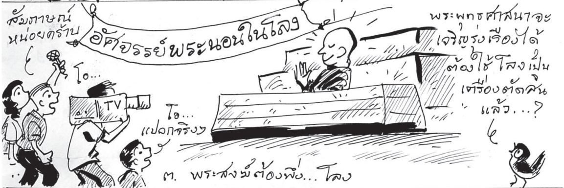
๓. พระสงฆ์ต้องพึ่ง... โลก